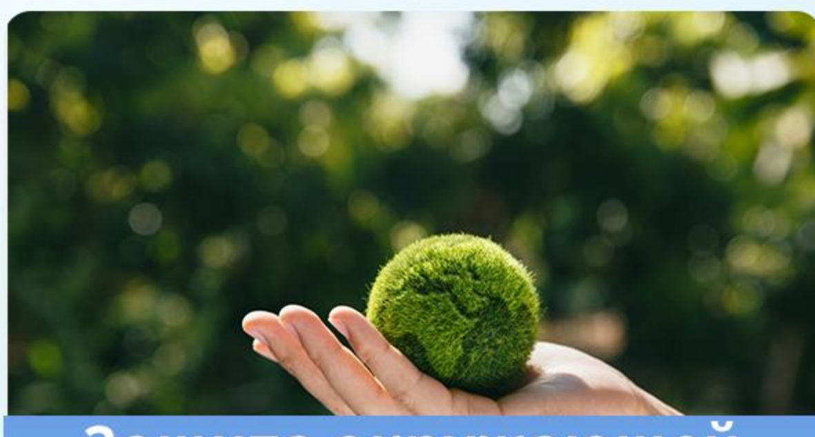
Защита окружающей среды