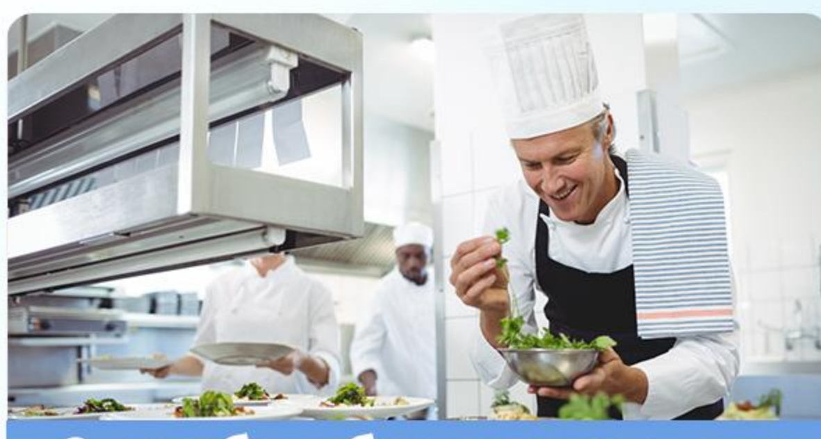
Служба общественного питания